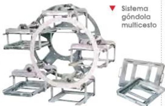
▼ Sistema góndola multicesto