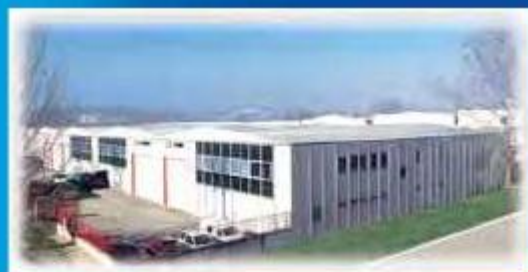
Sede CENTRAL en Palau-Solità i Plegamans (Barcelona), España