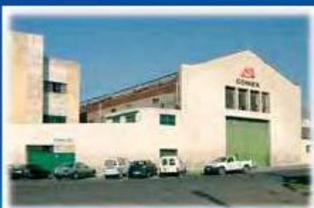
Filial en CASABLANCA, Marruecos

INSTALACIONES Y PRODUCTOS RESPETANDO EL MEDIO AMBIENTE