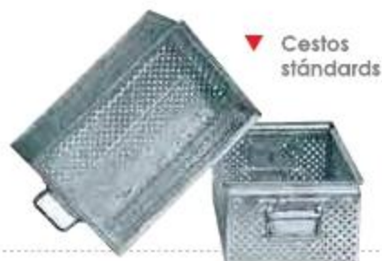
▼ Cestos estándares