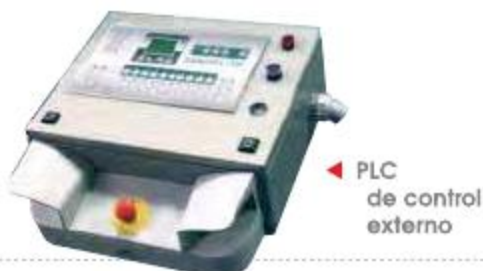
▼ PLC de control externo