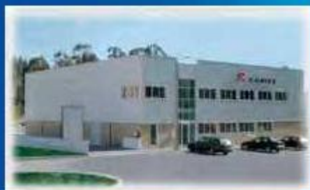
Filial en MAIA, Porto, Portugal

ESPECIALISTAS EN LAVADO Y DESENGRASE INDUSTRIAL