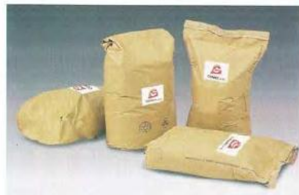
ABRASIVOS Corindon, microsferas de vidro, cerâmica, plástico, granalhas metálicas.