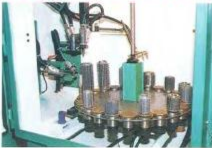
GRANALHADO A AR COMPRIMIDO EM AUTOMÁTICO Maquinas e instalações manuais ou automáticas por jacto d granalha de peças em seco.