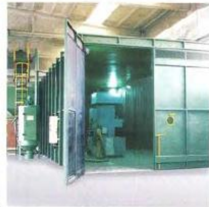
CABINES Desenho e construção de cabines à medida, com recuperação total ou parcial.