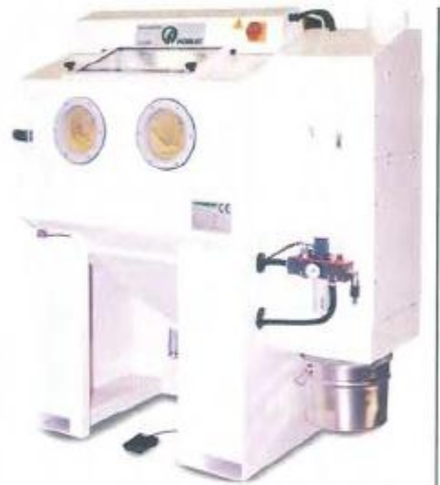
GRANALHADORAS COMPACTAS Com filtros de cartuchos incorporados