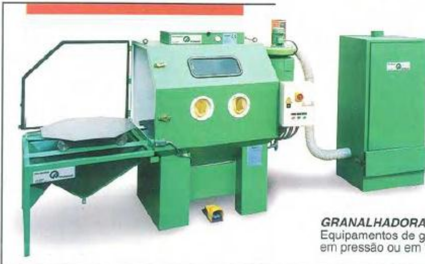
GRANALHADORA EM SECO Equipamentos de granalhagem em seco, em pressão ou em "venturi" (succção).